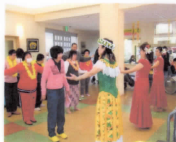
ハワイアンダンス