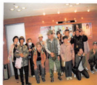
コロッケ特別公演