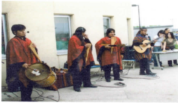
ペルー「KERUMANTU」コンサート 異国のアンデス音楽!!