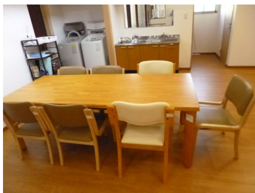
食事用テーブル・イスセット